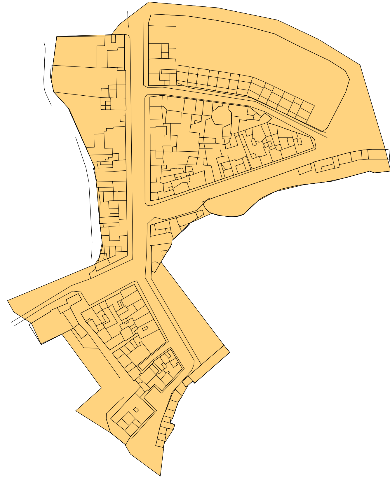
ZONIFICACIÓN CASCO URBANO DE BOBADILLA ORDENANZA DE ALUMBRADO PÚBLICO. ANEXO B. NOVIEMBRE 2013